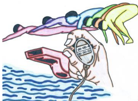
Deze tekening is gemaakt door Yosca Bozelie