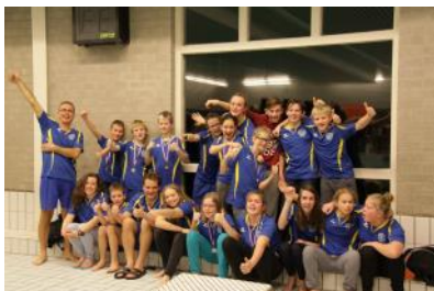
Aspiranten en Junioren