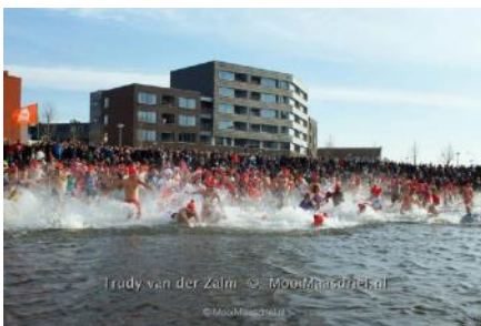
Daar gaan ze ...